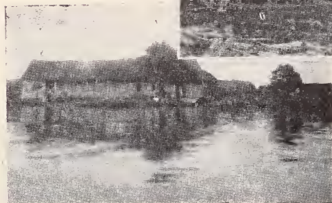
—Misión de Guayo.—Arriba: dos vistas de la Casa de las Hermanas Misioneras. Abajo: Casa de los Misioneros.